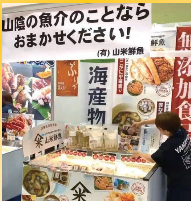
会員事業者の販路開拓を支援。商談会での出展風景【6 ページに関連記事】