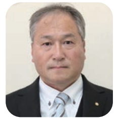
新温泉町商工会会長