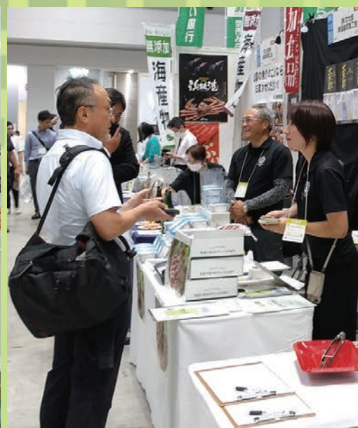
『地方銀行フードセレクション（東京ビッグサイト）』出展の様子