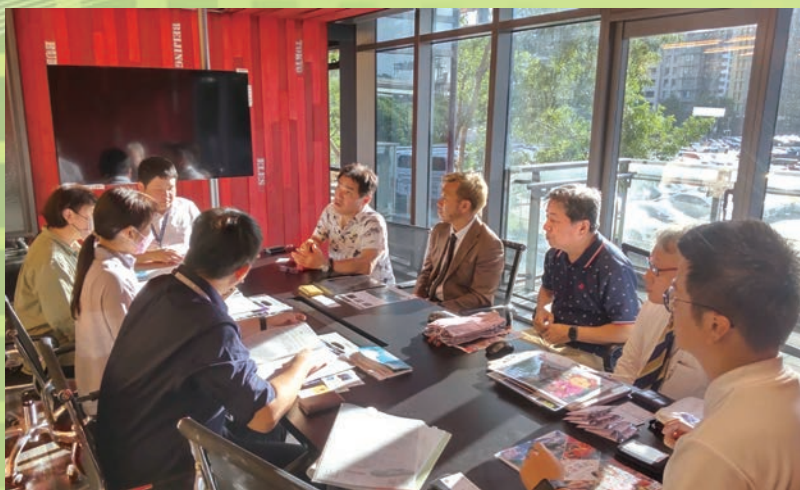
『台北国際秋季旅展』出展、台湾の旅行社へのセールスコールの様子